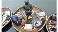
Fish caught from Kochi backwaters by traditional fishers from Karnataka using bamboo basket (Ketta Vanchi) is in big demand during the past few days amidst reports about formalin sprayed fish dominating the market. - SUNJOY NINAN MATHEW.